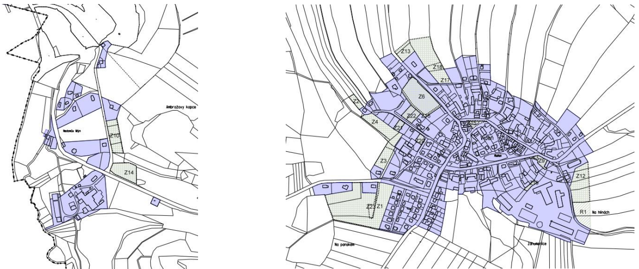
Obr. 2 Výřez z výkresu základního členění – zastavitelné plochy vymezené v ÚP Vídeň

Do doby zpracování zprávy o uplatňování byly využity hlavně plochy Z9 a Z21, které jsou zastavěny ze 100 %. V každé ploše byl postaven jeden rodinný dům. V ploše Z10 byl dosud postaven 1 RD, zbylé stavební pozemky nebyly zastavěny. Největší zastavitelná plocha Z1 a s ní související plocha veřejného prostranství Z23 prozatím zastavěna není, ale úřad územního plánování vydal celkem 8 závazných stanovisek pro budoucí výstavbu 8 RD. V lokalitě v současné době dochází ke zasilování. Dále je využita plocha Z15, kde vzniklo veřejné prostranství se zelení. Ostatní rozvojové plochy využity nebyly.